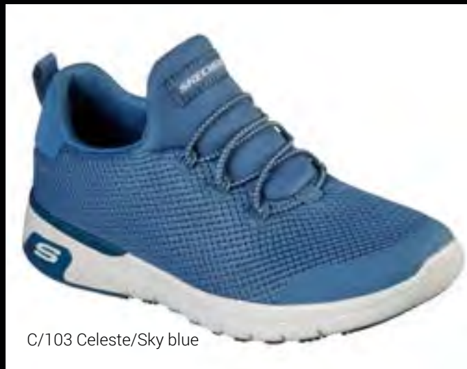
C/103 Celeste/Sky blue