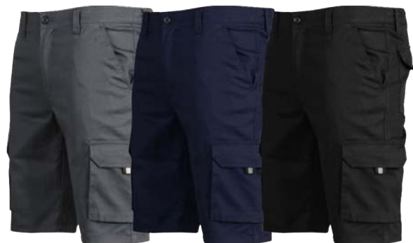
C/109 GRIS GREY