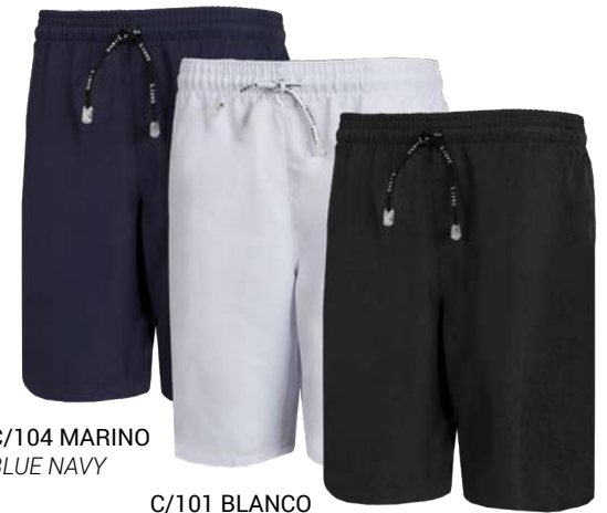
C/104 MARINO BLUE NAVY