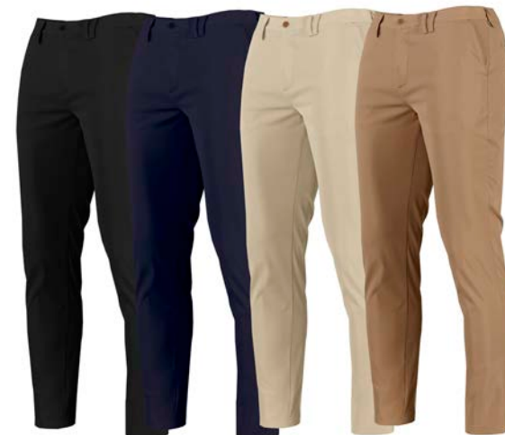
C/001 NEGRO BLACK C/104 MARINO BLUE NAVY C/110 BEIGE C/151 CAMEL

REF. 700027 PANTALÓN CHINO HOMBRE/CHINO PANT MAN SIZES 36-60 SARGA/TWILL 177gr/m 2 100%PES