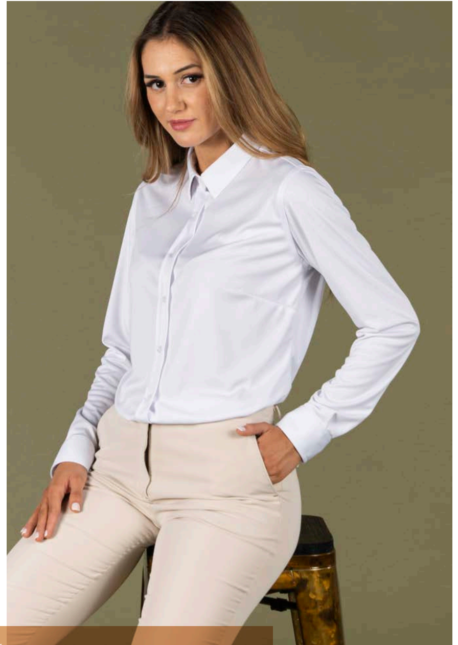
REF. 700027 PANTALÓN CHINO HOMBRE/CHINO PANT MAN (P. 33) REF. 700028 PANTALÓN CHINO MUJER/CHINO PANT WOMAN (P. 33)