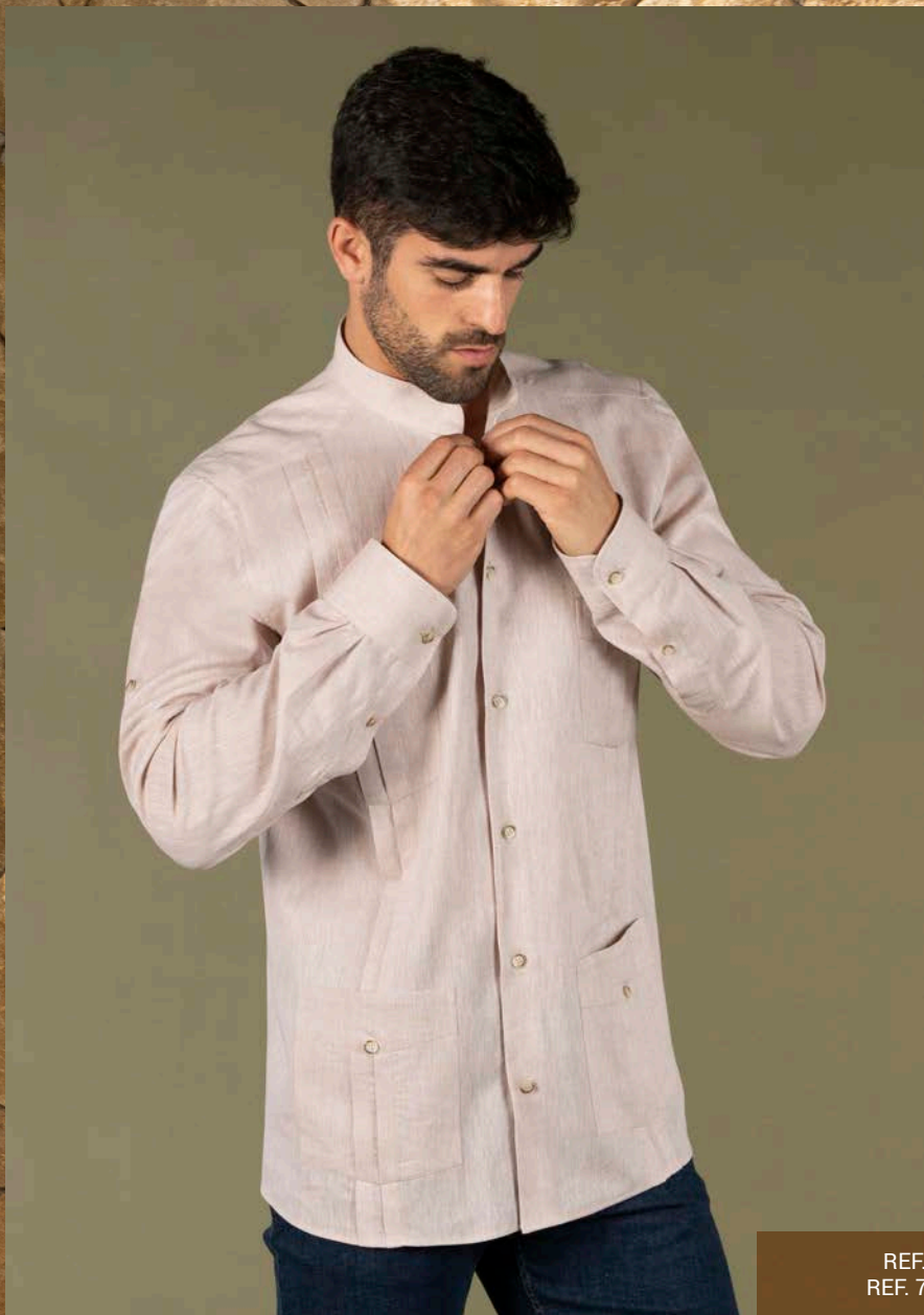
REF. 700027 PANTALÓN CHINO HOMBRE/CHINO PANT MAN (P. 33) REF. 700028 PANTALÓN CHINO MUJER/CHINO PANT WOMAN (P. 33)