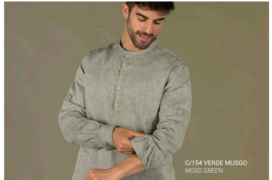
C/154 VERDE MUSGO MOSS GREEN