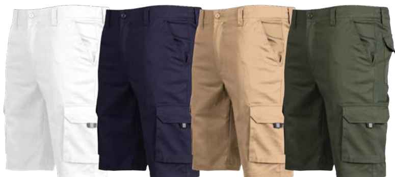
C/101 BLANCO WHITE