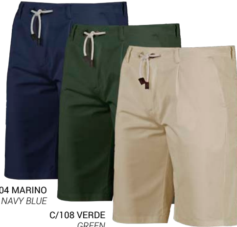
C/104 MARINO NAVY BLUE

The water-repellent fabric has received a treatment that makes the garment avoids moisture and filtrations, so the water won't create a layer on the surface with makes this fabric highly breathable.