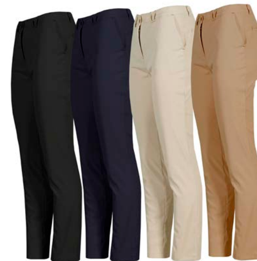
C/001 NEGRO BLACK C/104 MARINO BLUE NAVY C/110 BEIGE C/151 CAMEL

REF. 700028 PANTALÓN CHINO MUJER/CHINO PANT WOMAN SIZES 36-58 SARGA/TWILL 177gr/m 2 100%PES