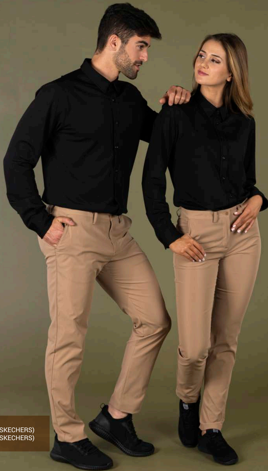
REF. SK77188EC HOMBRE/MAN (P. 23 CAT. SKECHERS) REF. SK77210EC MUJER/WOMAN (P. 25 CAT. SKECHERS)

REF. 700027 PANTALÓN CHINO HOMBRE/CHINO PANT MAN SIZES 36-60 SARGA/TWILL 177gr/m 2 100%PES