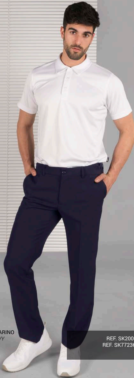
C/104 MARINO BLUE NAVY

REF. SK200051 EC HOMBRE/MAN (P. 9 CAT. SKECHERS) REF. SK77236 EC MUJER/WOMAN (P. 17 CAT. SKECHERS)