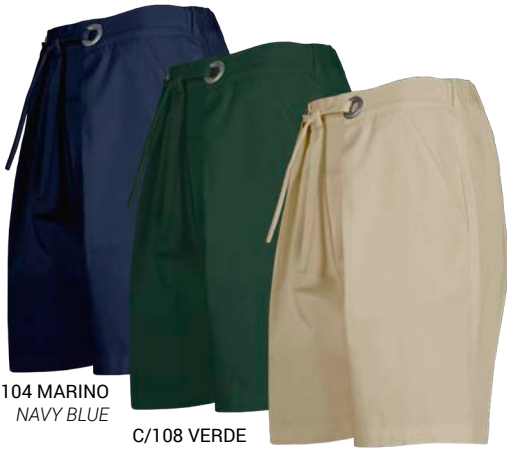
C/104 MARINO NAVY BLUE