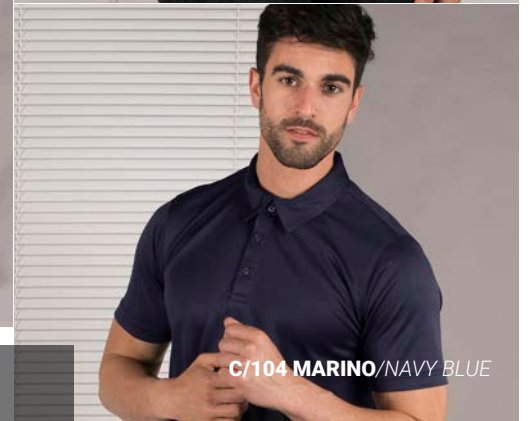
C/104 MARINO/NAVY BLUE