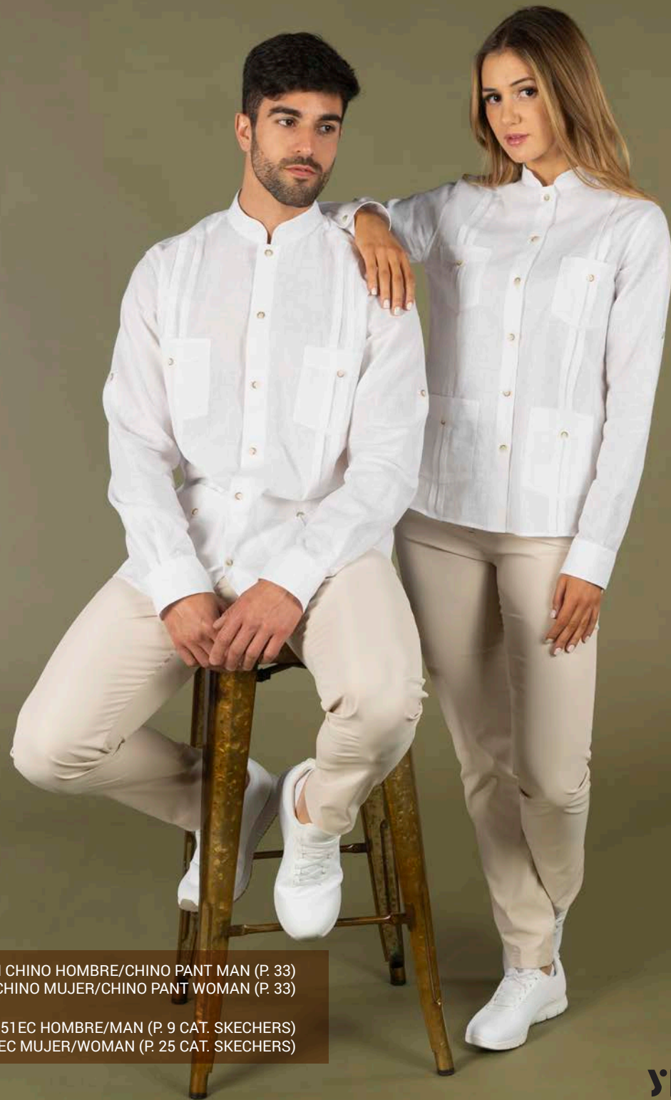
REF. SK200051EC HOMBRE/MAN (P. 9 CAT. SKECHERS) REF. SK77210EC MUJER/WOMAN (P. 25 CAT. SKECHERS)