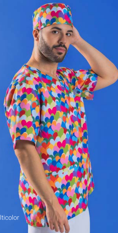
c/5149 Cuore multicolor