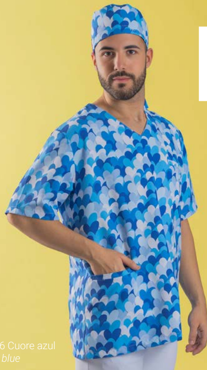
c/5146 Cuore azul Cuore blue