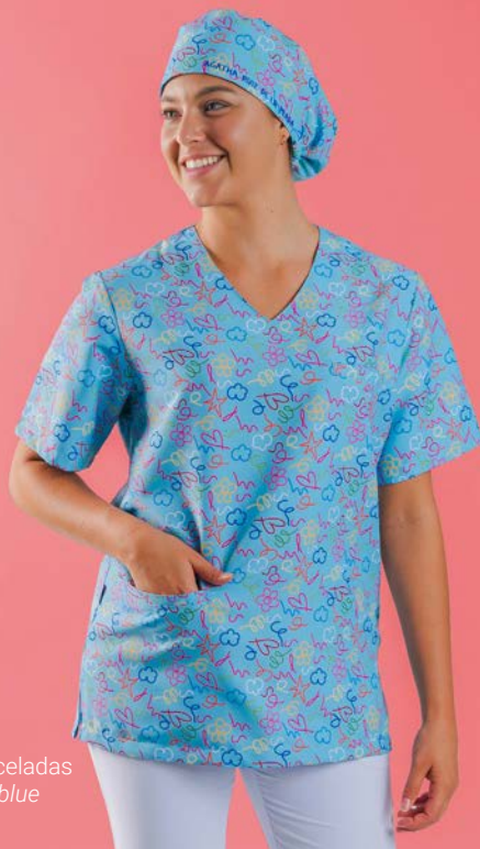
c/5153 Pinceladas Pinceladas blue