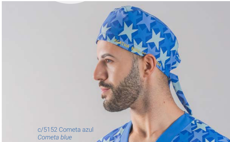
c/5152 Cometa azul Cometa blue

Con tejido absorbente para sudoración en el frontal interior.