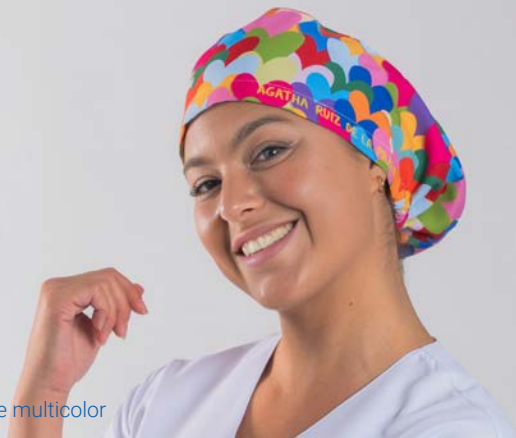
c/5149 Cuore multicolor