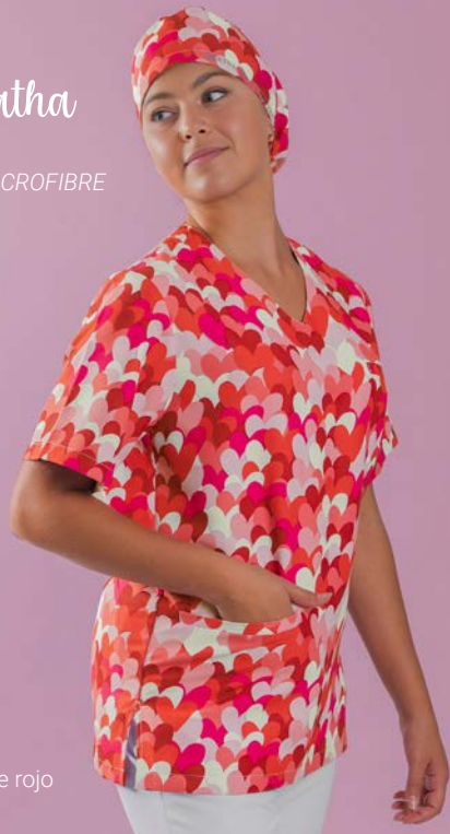
c/5147 Cuore rojo Cuore red

Unisex MICROFIBRA/MICROFIBRE 148 gr/m 2 100% PES XS-XXL