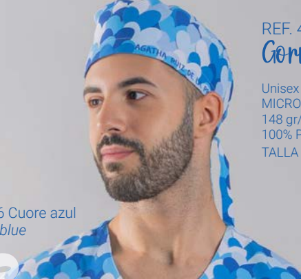
c/5146 Cuore azul Cuore blue

Unisex MICROFIBRA/MICROFIBRE 148 gr/m 2 100% PES TALLA ÚNICA/ONE SIZE