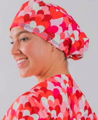
c/5147 Cuore rojo Cuore red

Unisex MICROFIBRA/MICROFIBRE 148 gr/m 2 100% PES TALLA ÚNICA/ONE SIZE