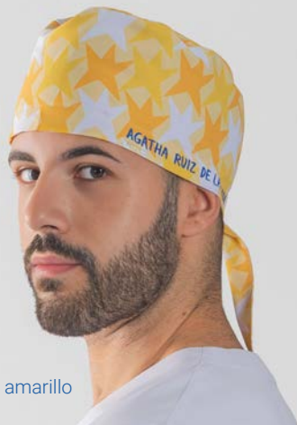
c/5151 Cometa amarillo Cometa yellow